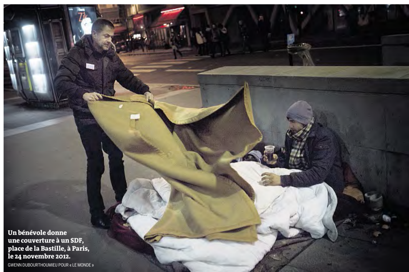
Un bénévole donne une couverture à un SDF, place de la Bastille, à Paris, le 24 novembre 2012.

Des collectifs spontanés agissent en dehors du 115 et des associations traditionnelles LIRE PAGE 11