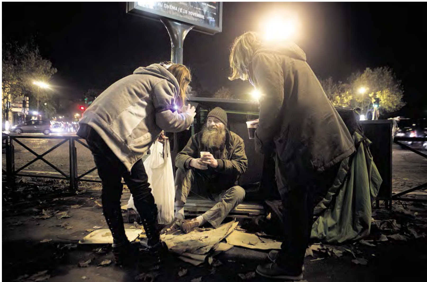
Deux bénévoles du collectif ActionFroid en maraude dans le 12 e arrondissement de Paris, fin novembre.

Selon le dernier baromètre du 115, dévoilé mercredi 5 décembre par la Fnars, la prise en charge des sans-abri s'est encore détériorée depuis un an. Sur les 37 départements étudiés, 71 % des demandes d'hébergement n'ont pas abouti, soit une augmentation de 57 % de non-attribution par rapport à novembre 2011. Les familles représentent désormais 53 % des demandes, en hausse de 60 % en un an. Cette tension affecte des territoires jusque-là relativement épargnés, comme la Dordogne, le Doubs, le Morbihan ou encore la Nièvre. Mercredi 5 décembre, un collectif qui réunit les principales associations ainsi que les professionnels de l'urgence sociale, organise à Paris une opération « coup-de-poing », destinée à interpeller le gouvernement à quelques jours de la Conférence nationale contre la pauvreté et pour l'inclusion sociale des 10 et 11 décembre.