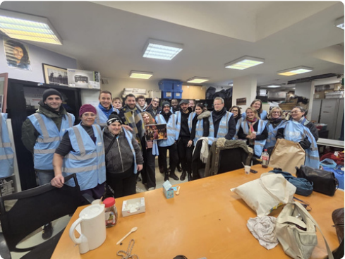
Maraude du 3 janvier 2026