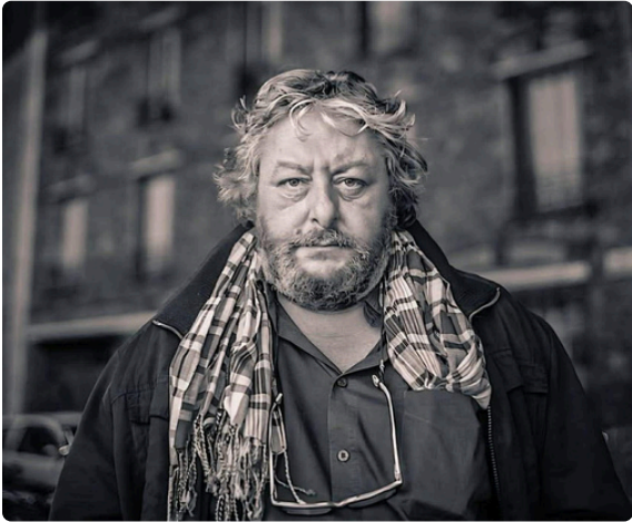
“Quand nécessité fait loi, les citoyens sont là.”